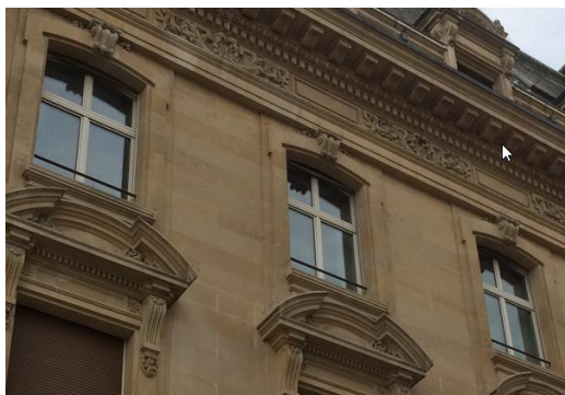
Figure 1 - Exemple bâtiment des postes

Rappelons que les fenêtres ont un grand impact sur l'aspect des façades et même si les nouvelles seront en bois, leur aspect en sera moins beau que les fenêtres actuelles à petits carreaux même et cela même si elles sont en PVC.