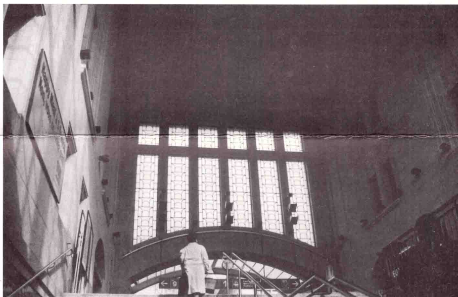
Gare de Lausanne, hall est

En prenant fait et cause pour ce patrimoine, le Mouvement pour