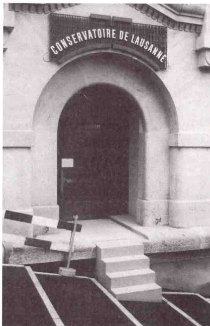
Conservatoire: entrée ouest après réaménagement