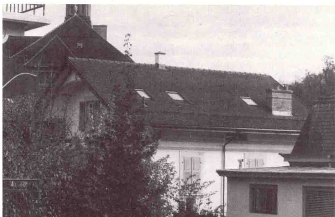
Av. de Milan, exemple de tabatières à fleur de couverture

L'installation de grandes tabatières (désignées couramment par l'appellation «Velux») pose fréquemment un problème délicat en ce qui concerne l'esthétique des toitures. Elles sont souvent placées de façon anarchique, sans cohérence de taille et de position, ni rapport aux façades. Leur im-