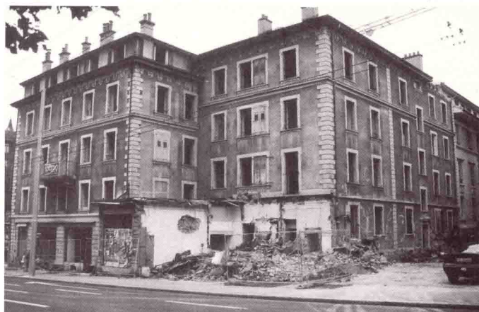
Av. d'Ouchy 36-38

Cette affirmation rejoint le souci de l'éminent architecte Luigi Snozzi qui affirme: «Si vous ne faites qu'aligner des beaux bâtiments, vous n'aurez jamais entre eux que des espaces résiduels invivables. Nous sommes encombrés de plans de zones qui ne sont plus adaptés aux besoins actuels. Il faut trouver de nouvelles règles, tenter de mieux définir les espaces publics, trouver une continuité dans la diver-