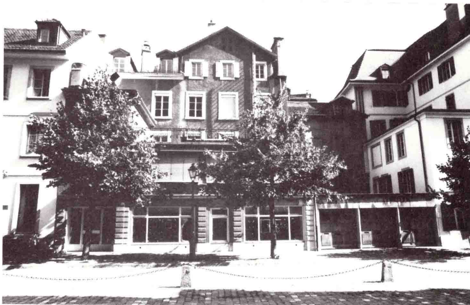
Rue Vuillermet 2-4, vue du sud, état août 1998.

Le projet récemment mis à l'enquête publique ne répond pas, à notre avis, à ces exigences. Après démolition des deux bâtiments existants et de leurs annexes, on insérerait, dans le tissu ancien de grande valeur et faisant directement face au côté nord de la Cathédrale, un im-