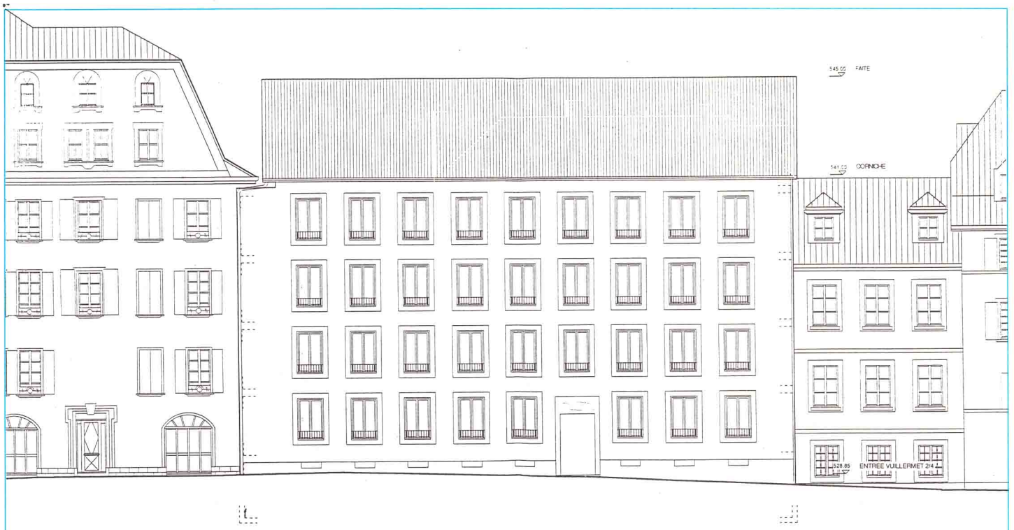
Projet rue Vuillermet 2-4, façade nord (U. Brauen, architecte).

Ces réflexions remarquables de Léon Krier nous paraissent propres à faire naître un nouveau courant