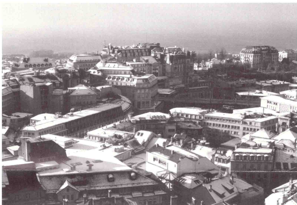
▲ Les quartiers de la fin du XIXe siècle et du début du XXe siècle sont à placer dans une zone "à soigner". Ici, vue sur le Grand-Pont et Saint-François depuis le beffroi de la Cathédrale.

MDL - Case postale 3265 - 1002 Lausanne Téléphone et télécopieur: 021 617 37 67