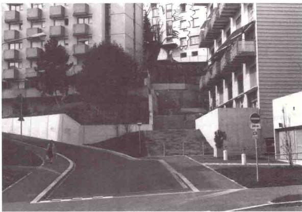
▲ Chemin des Crêtes débouchant sur la rue de la Borde