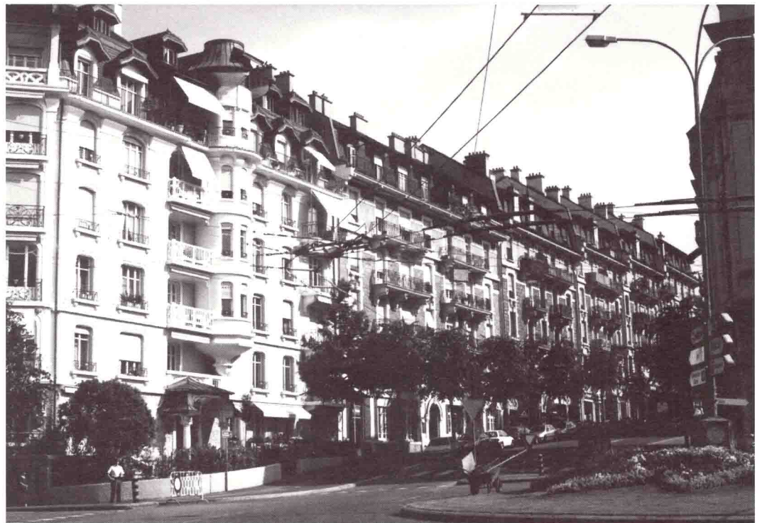
▲ Avenue Fraisse 4-14 Magnifique exemple d'un ensemble architectural de type mitoyen.

Dans le domaine de la construction, nous constatons que les limites à bâtir sont systématiquement considérées aujourd'hui comme des droits à bâtir. Dans la mesure où le principal étalon en vigueur actuellement pour définir la construction est avant tout celui du rendement économique, le règlement communal se doit de corriger cette tendance qui relègue au second plan les notions de qualité, d'intégration, d'harmonie, d'insertion dans l'environnement bâti, de définition des vides et des pleins. Une piste pour aboutir à un meilleur résultat consisterait à travailler plus abondamment avec les coefficients d'utilisation et d'occupation du sol, ainsi que sur les volumétries maximum. Ce faisant, les architectes disposeraient systématiquement, face à leur commanditaire, de variantes de construction avec des choix d'intégration et des options constructives aptes à améliorer les projets.