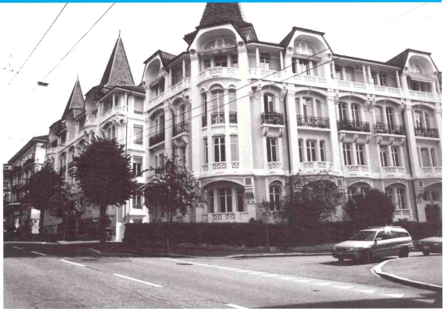
▲ Avenue de la Harpe 1, rue J.-J. Cart 6-8

Un autre exemple d'ensemble architectural exceptionnel, sous forme de square ouvert.