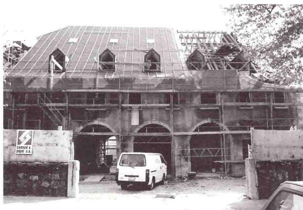
▲ La ferme de Béthusy