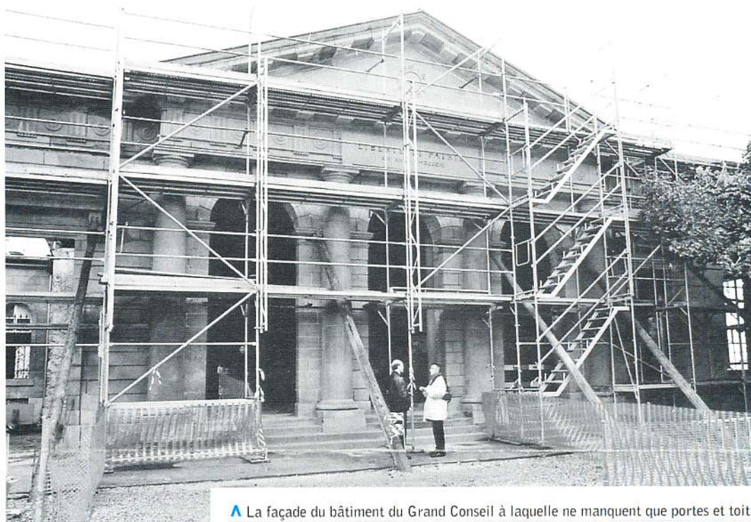
▲ La façade du bâtiment du Grand Conseil à laquelle ne manquent que portes et toit. Voir en page 4.

MDL - Case postale 3265 - 1002 Lausanne Téléphone et télécopieur: 021 617 37 67