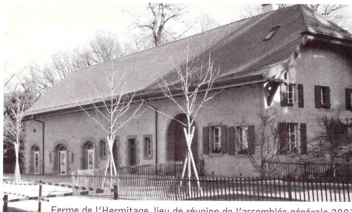
Ferme de l'Hermitage, lieu de réunion de l'assemblée générale 2003

Nous avons le plaisir de vous convier à l'assemblée générale annuelle 2003 du Mouvement pour la Défense de Lausanne, mercredi 21 mai à 19.30 heures Ferme de l'Hermitage, route du Signal 2 (entrée par l'espace d'accueil de la maison de l'Hermitage)