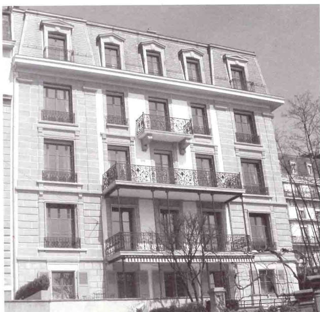
Immeuble avenue Agassiz 2. Façade sud. Avril 2004.

Suite à un incendie survenu le 3 octobre 1950, la toiture est reconstruite. En 1958, le Centre patronal aménage le 3ème étage et les combles, qui servaient de galetas. Vingt