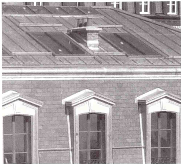
Immeuble avenue Agassiz 2. Intégration élégante et subtile de verrières en toiture.

ans plus tard, ce sont les sous-sols qui se trouvent à leur tour colonisés par les bureaux et agrandis. Le bâtiment n'a pas subi de transformation importante depuis sa construction, mais l'intérieur a tout de même été malmené au fil des ans. Conçu comme immeuble résidentiel d'un certain standing, avec un seul appartement par étage, les aménagements intérieurs