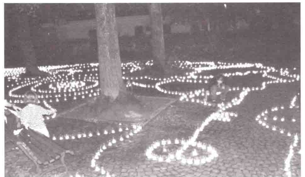
Illumination de la promenade du Crêt (Escaliers du Marché).

Les sites ainsi illuminés ont été admirés par plus de 40'000 visiteurs, venus pour certains de loin. Cet acte artistique est un exemple d'animation extraordinaire. Sans buvette, ni musique tonitruante, la ville, dans sa beauté brute, simplement rehaussée par un acte citoyen, a réussi à drainer des dizaines de milliers de personnes, venues pour une découverte, et qui sont reparties avec un souvenir lumineux et d'enchantement.