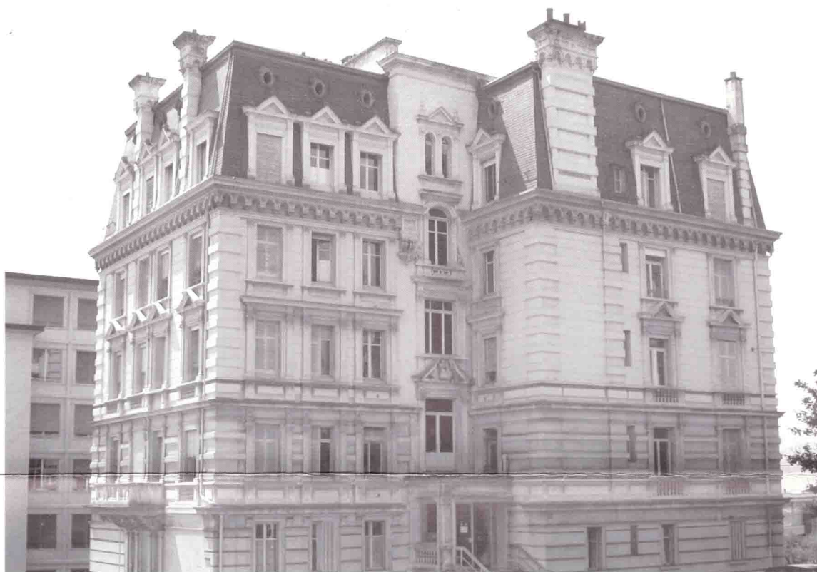
Bâtiment avenue de la Gare 39, état août 2006.

MDL - Case postale 6929 - 1002 Lausanne www.mdl-lausanne.ch info@mdl-lausanne.ch téléphone et télécopieur: 021 617 37 67