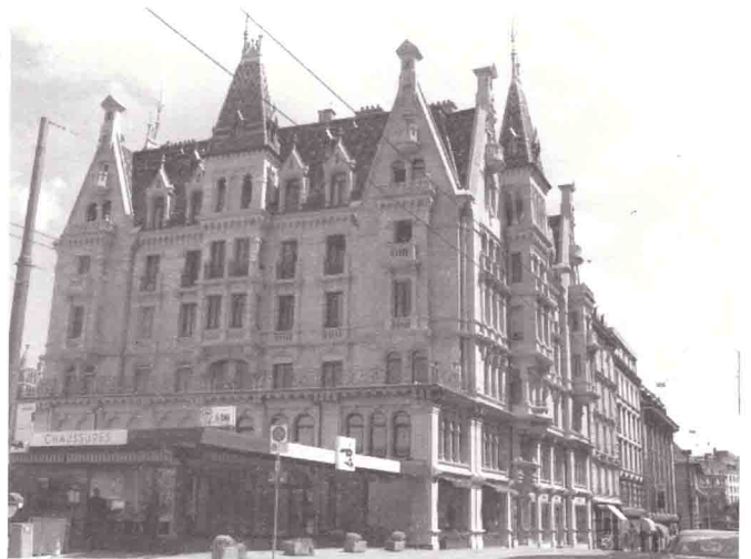
Maison Mercier, Grand-Chêne 8, autre oeuvre de F. Isoz.

Ces bâtiments sont des joyaux architecturaux du Lausanne 1900. Le bâtiment avenue de la Gare 39 fait partie de cette belle famille et sa sauvegarde et sa restauration s'imposent véritablement.