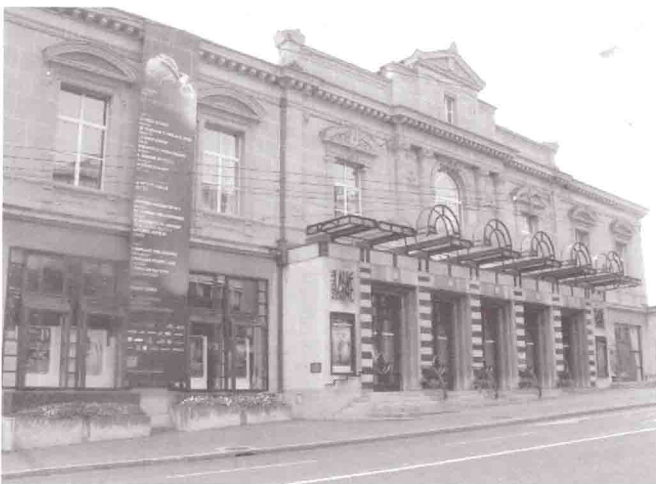
Avenue de l'Eglise Anglaise, printemps 2005.

Un concours d'architecture proclame vainqueur la proposition des architectes Devanthery et Lamunière, qui, selon l'avis de