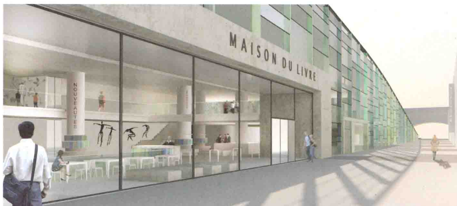
Projet pour la Maison du Livre.

En plus de se trouver dans une zone inconstructible, ce bâtiment dérogerait encore à la loi forestière. Pour justifier cette implantation hors de tout cadre légal, la Municipalité a l'outrecuidance d'invoquer l'intérêt public. Justifier de cette manière cette construction est un abus. On peut en effet parfaitement et adéquatement bâtir ailleurs cet objet. Cet abus de la notion d'intérêt public est un dérapage. A cette aune, tout construction pourrait invoquer ce statut dérogatoire: le logement, car il y a pénurie, les bistrotts, car il faut bien désaltérer et nourrir les foules, et même les boîtes de nuit, puisque le peuple doit pouvoir s'amuser. Non, cette transgression évidente des règles à bâtir discrédite gravement nos institutions et les règles de l'état de droit. S'il n'y a pas de normes pénales qui pourraient sanctionner de tels agissements, il n'est en revanche pas contestable que ce geste est un acte délictueux et une marque de profond irrespect des citoyens et des institutions.