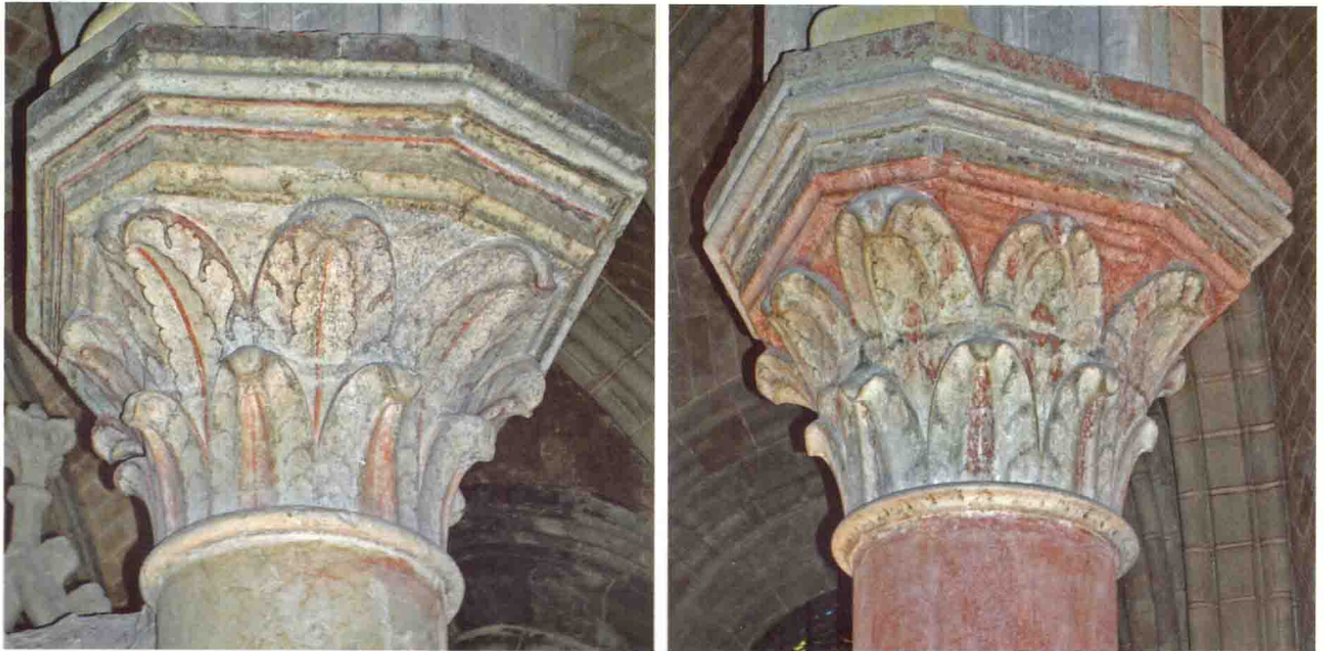
Cathédrale de Lausanne, chœur. Une richesse insoupçonnée: les chapiteaux des deux premières colonnes du côté nord. Les polychromies sont quasi invisibles sans un éclairage adéquat.

MDL - Case postale 6929 - 1002 Lausanne www.mdl-lausanne.ch info@mdl-lausanne.ch téléphone et téléfax: 021 617 37 67