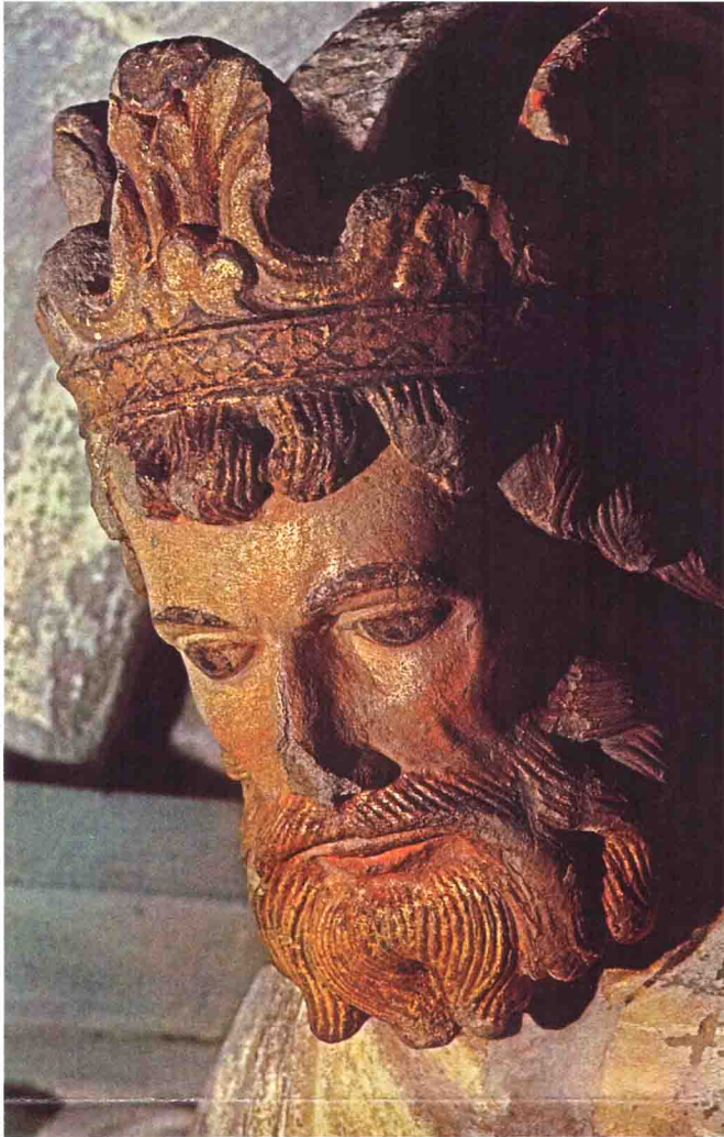
Cathédrale de Lausanne, portail peint. Le roi David, poète de chants d'amour (Psaumes). Restauration: Atelier Crephart-Hermanès.

maître de l'ouvrage et renonce à la poursuite des opérations sur cet objet. C'est à ce moment que cesse définitivement toute collaboration avec le Service des Bâtiments du canton de Vaud.